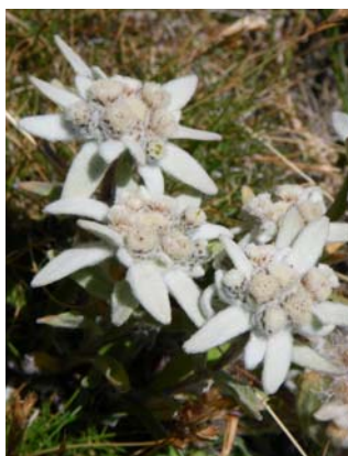
Edelweiss Région Saas Fee