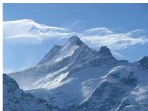
Schreckhorn Klein Schreckhorn